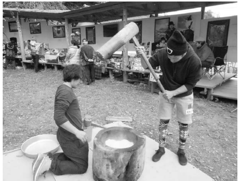
▼冒険ラリー時に行った餅つき

尚、餅は十分に用意しますが、数に限りがありますので、餅のみをご要望の方は早めの御来場をお願いします。